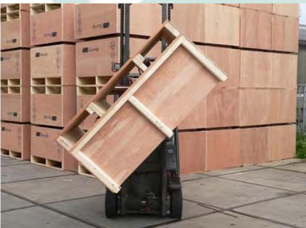
Mit einer Zusatzvorrichtung in der Palette können die Kisten sicher mit Gabelstapler gedreht werden.