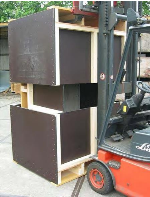
Kisten lassen sich platzsparend stapeln.