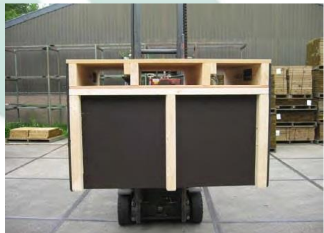
Die Kisten können sich zwischen dem Träger nicht bewegen. Eine Beschädigung der Palette wird verhindert. Sanfte Saatgutdosierung.