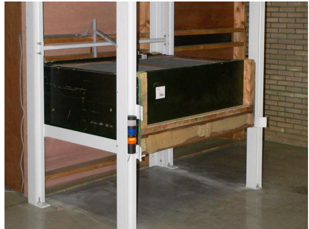
LED Lampe geben einen Hinweis von Status der Trocknung. Orange: Start trockenen, blau: letzte Stufe, weiß: Trocknung fertig.