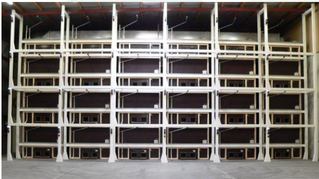
Beispiel Anlage ohne Kisten.