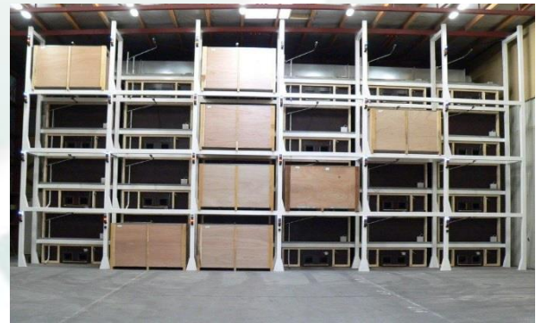
Die Installation ist teilweise gefüllt mit Kisten