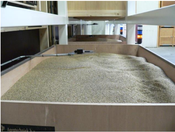
Die Kondition ( T^\circ und rF ) von der Luft aus den Samen wird oben jeder Kiste gemessen.