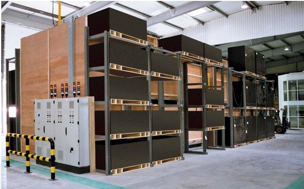
Trocknen einzelner Kisten auf den gewünschten Feuchtigkeitsgehalt des Saatguts.